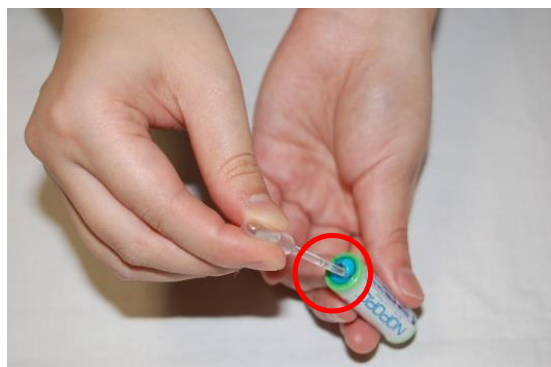
ラジオ、水電池2本、スポイト

1回目：スポイトをきちんと奥まで差しませんでした。 そのため、水が溢れるまで注水しましたが、 ラジオが鳴りませんでした（発電不良）。